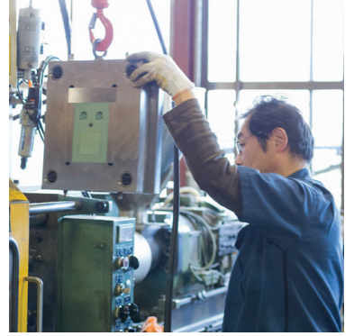
被放到注模機上的 3D 列印模具