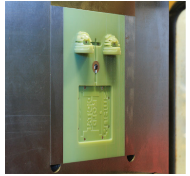
附在注模機底座的 3D 列印模具

橋本先生總結：「有人說 3D 列印技術剝奪了模具公司的發展機會；對於蘇旺你來說，3D 列印技術卻同時為 3D 列印和模具製造這兩個領域創造了就業機會。如果這種新合作方式可以振興日本製造業，這將是非常了不起的事情。」