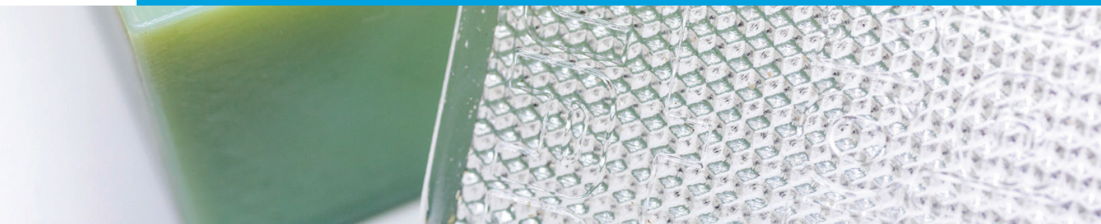
用於金屬墊板，進而製成成品的 LED 車燈反射鏡注塑原型